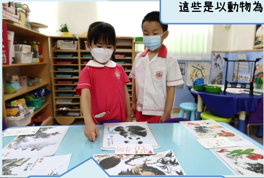
看看這些都是吉祥的動物。