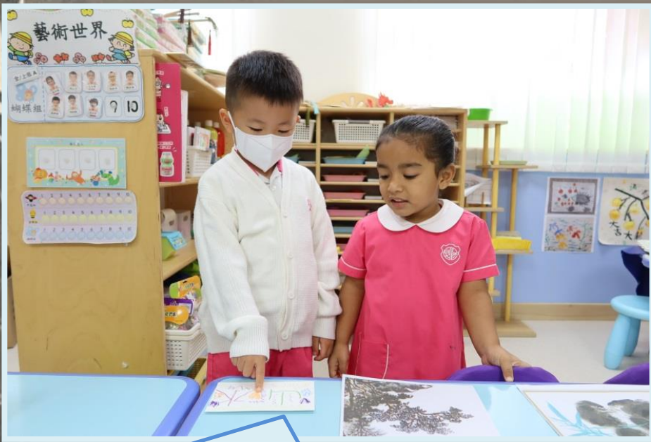
這些是以山水為題材的作品。