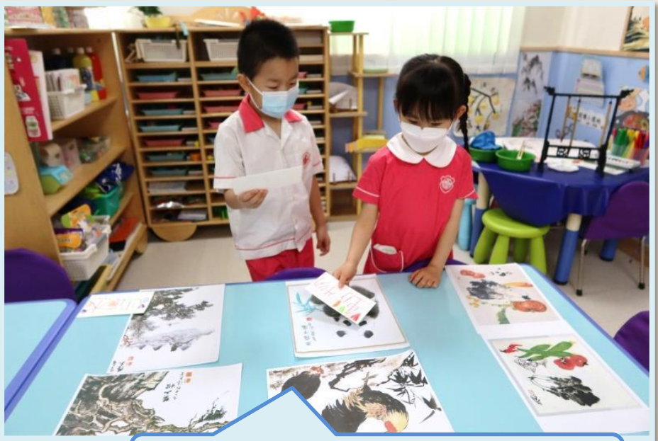
這些是以動物為題材的作品。