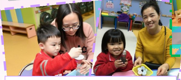
正向親子講座及心靈樽製作活動