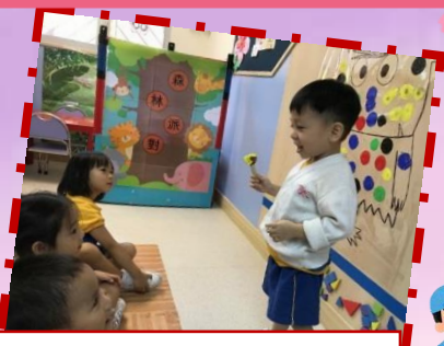
每天向同儕分享自己的心情和經歷