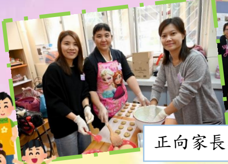
正向家長小組曲奇製作活動