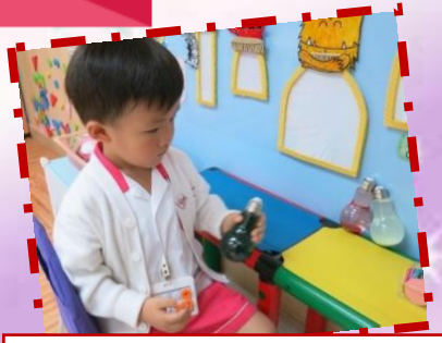
運用心靈樽平靜心情

本校一向重視幼兒的全面成長，透過正向教育幫助教職員、家長及幼兒建立成長型思維，發揮個人性格強項，多欣賞自己，獲取滿足感和自信心，並以正向樂觀的態度去面向人生的挑戰。