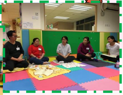
家長靜觀教育課程