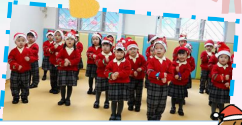
正向親子工作坊暨聖誕樂繽紛