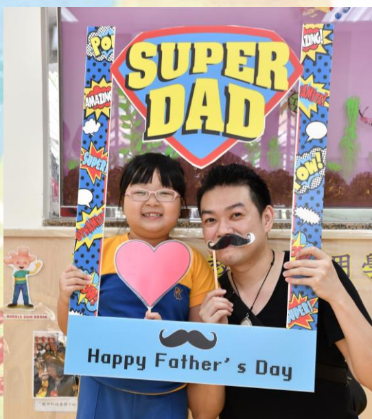
「超級爸爸挑戰日」父親節活動