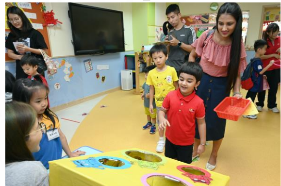
「感恩親親您」母親節活動