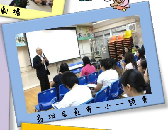
高班家長會一小一談會