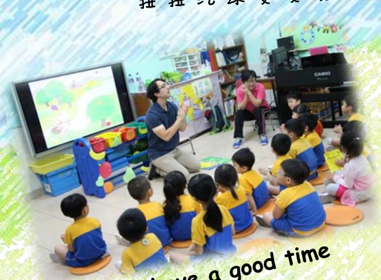
We have a good time