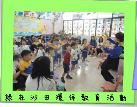
綠在沙田環保教育活動