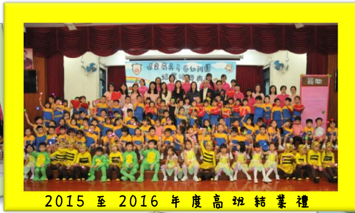
2015 至 2016 年度高班結業禮