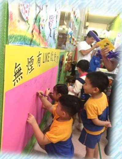
無煙新一代承諾行動