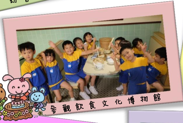
參觀飲食文化博物館