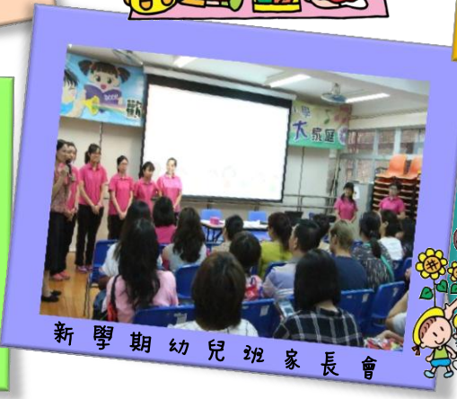
新學期幼兒班家長會