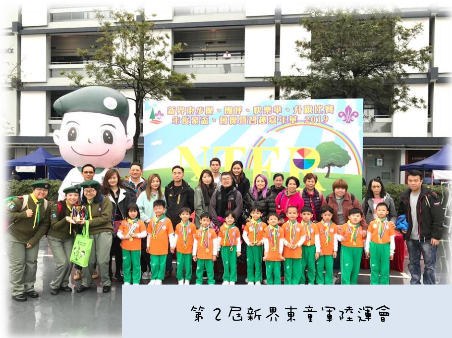
第2屆新界東童軍陸運會