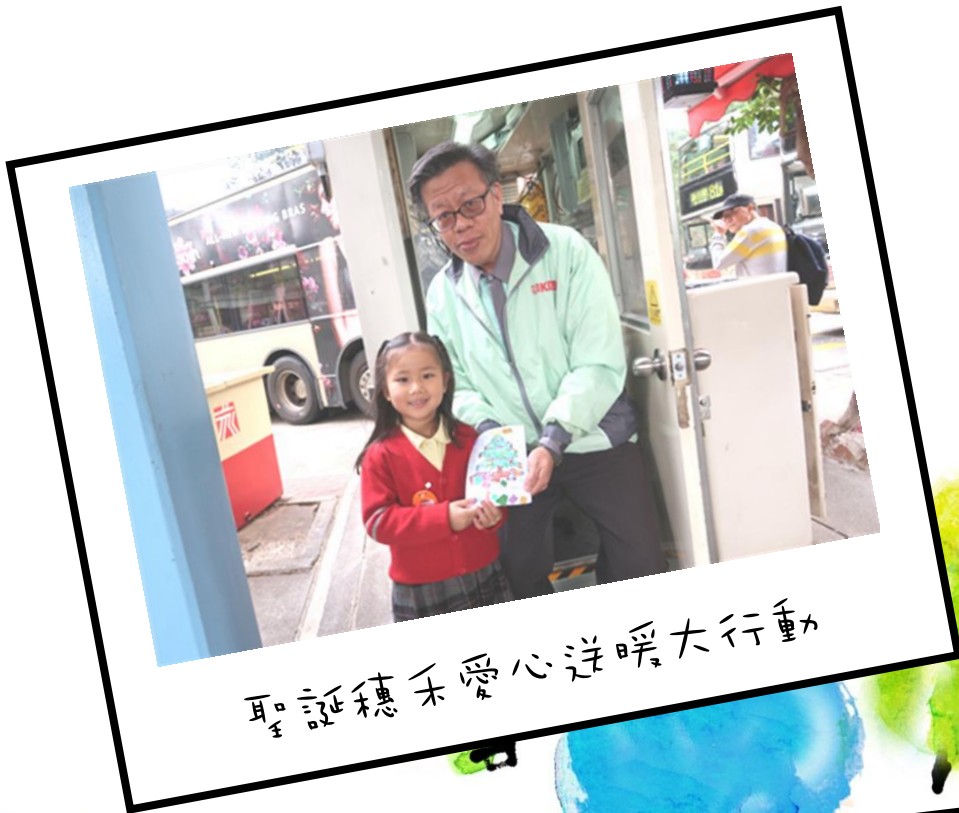
聖誕穗禾愛心送暖大行動