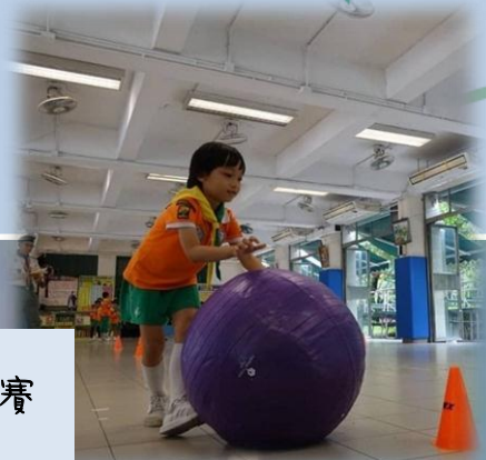
地域總監盃小童軍比賽