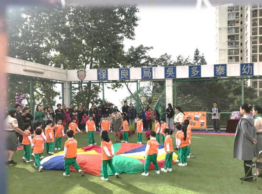
聖誕童玩綠校園暨小童軍宣誓典禮