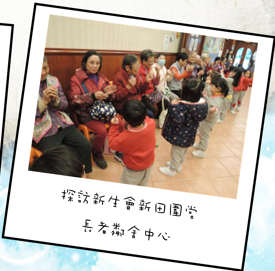
探訪新生會新田圍堂 長者鄰舍中心