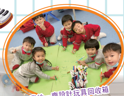
我哋一齊設計玩具回收箱