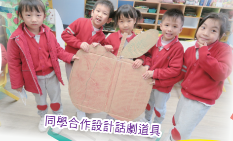
同學合作設計話劇道具