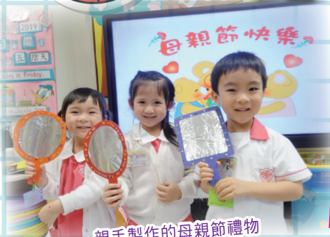
親手製作的母親節禮物