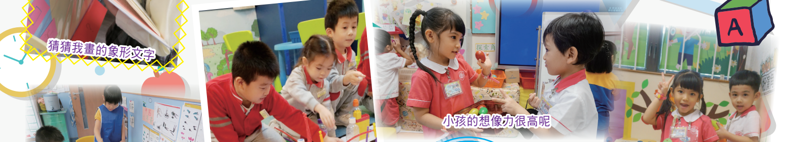
猜猜我畫的象形文字