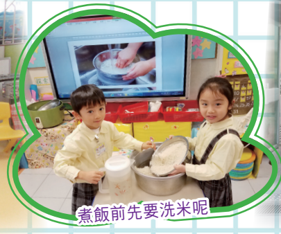
煮飯前要先洗米呢