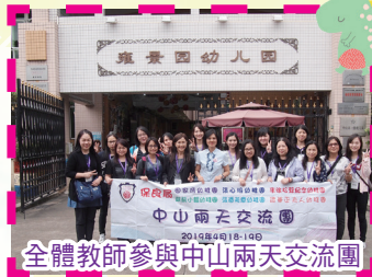
全體教師參與中山兩天交流團

度在校內所推行之活動及工作，實在非常之豐富，無論在教師、學生方面也獲益不少。在家長方面，本年度推行不少親子活動讓家長與子女一同參與，從而增加親子關係；在課程方面，今年度參與教育局舉辦之培養幼兒的品德發展專業支援計劃及自由遊戲，校方因應兒童喜歡遊戲的天性，安排了多元化的活動，讓兒童從遊戲中學習，如不同的探索活動、關愛座位、德育劇場、環保天地、玩具回收、親子品德故事創作比賽、無煙劇場、好寶寶計劃、慳電講座等，藉此培養兒童良好的品德。而教師方面，參加了教育局及不同大學、環保機構舉辦之工作坊、講座及培訓等，如參加教育局舉辦之語常會教師英文及中文之課程、認識非華語學生支援計劃、正向課程、玩學相長工作坊、主任參加保良局中層培訓工作坊、全體教師到境外中山參觀交流、校長到東莞及日本交流、教師升旗隊培訓課程、戲劇課程、推動環保課程等等，教師把所學的專業知識編排及運用在課程及環境佈置中，讓兒童能多些參加不同的活動；家長方面，本園在今年度參加了「綠在葵青」計劃，安排不同的親子環保活動，如環保酵素工作坊、環保小手工、舊衣新袋、膠樽花盆等，今年度更榮獲由環境運動委員會主辦「第十七屆香港綠色學校獎」（幼兒學校組）家長對環保活動的參與性的「最傑出表現獎」，表揚本園舉辦之活動能鼓勵學生及家長對環保的意識、實踐生活方面有傑出的表現。