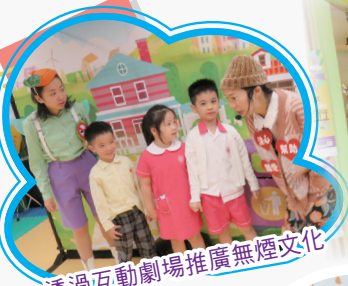
透過互動劇場推廣無煙文化