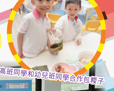
高班同學和幼兒班同學合作包餃子