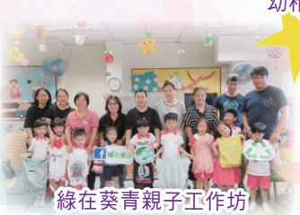
綠在葵青親子工作坊