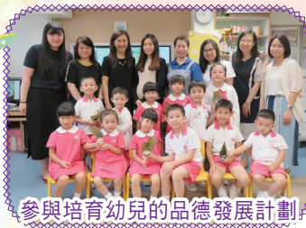
參與培育幼兒的品德發展計劃