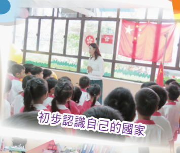
初步認識自己的國家