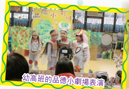
幼高班的品德小劇場表演

幼稚園階段是培育幼兒良好品德、初步建立是非觀念的關鍵時機。本年度繼續運用「情緒智慧小蘑菇」作輔助教材，在課程中更運用品德故事，設計不同的延展活動，如戲劇表演、時裝表演、情境遊戲、混齡活動、玩具回收等；更透過家校合作，如品德故事創作比賽、親子賣旗、定向活動、好寶寶計劃等，從生活化、人際互動的學習環境中，體會和實踐良好品德。