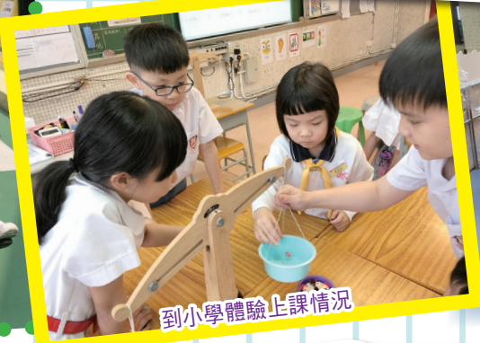
到小學體驗上課情況