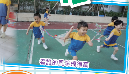
看誰的風箏飛得高