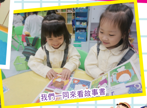
我們一同來看故事書