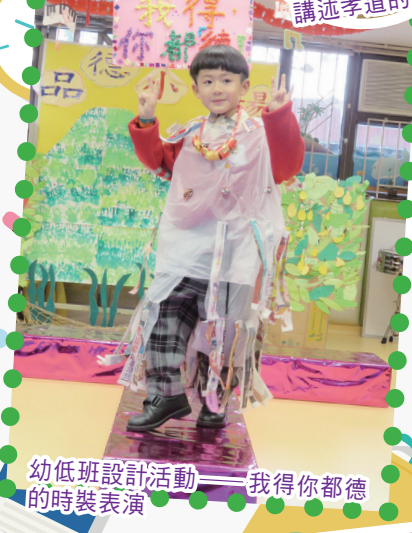
幼低班設計活動的時裝表演