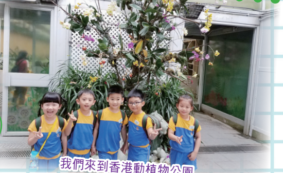
我們來到香港動植物園