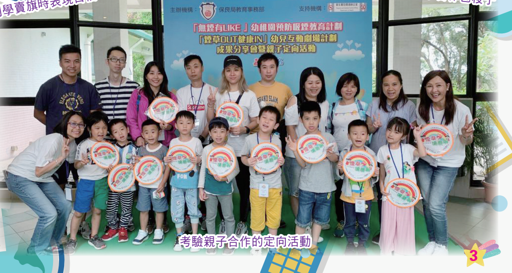
考驗親子合作的定向活動