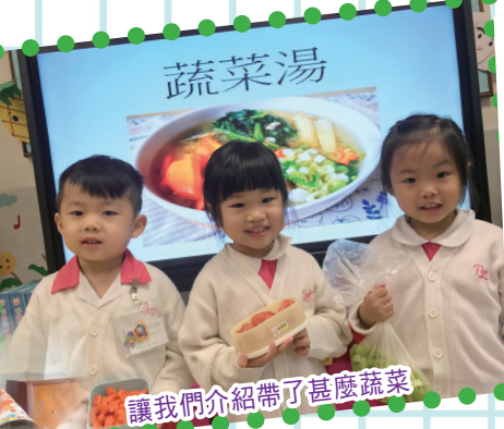
讓我們介紹帶了甚麼蔬菜