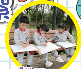
讓我把所見畫下來