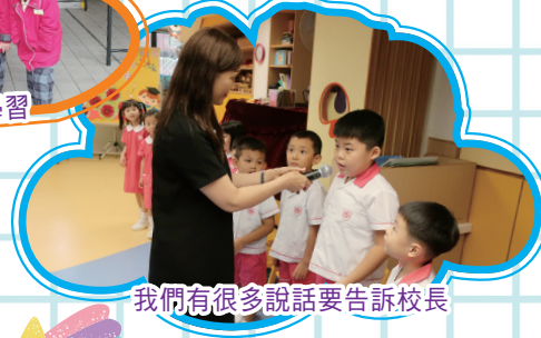
我們有很多說話要告訴校長