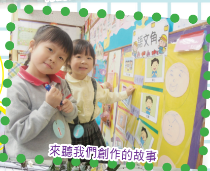
來聽我們創作的故事