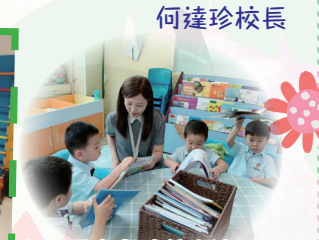
何校長參與境外交流活動