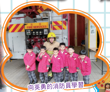
向英勇的消防員學習