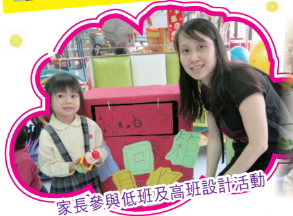
家長參與低班及高班設計活動