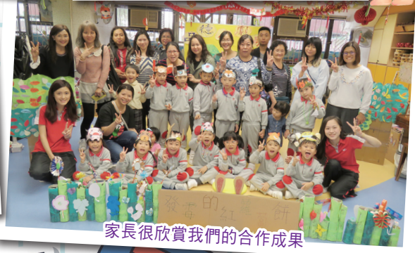
家長很欣賞我們的合作成果