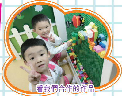
看我們合作的作品