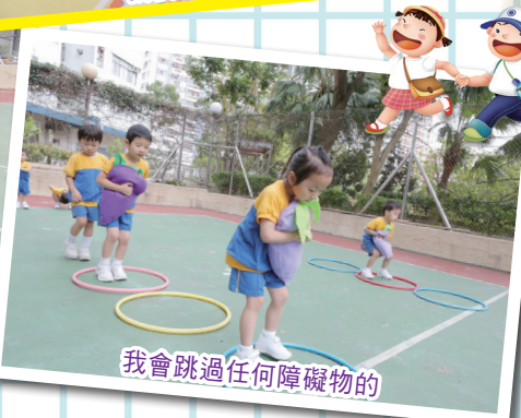
我會跳過任何障礙物的