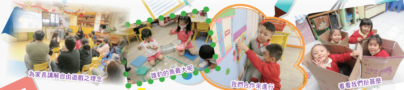
為家長講解自由遊戲之理念

自由遊戲能讓兒童按自己的步伐、能力、興趣自由探索。累積上年的經驗，本年度修訂了日常活動環節及時間，每級制定最少三十分鐘的自由遊戲時段，低班及高班更可自由參與各課室、活動室及走廊上所設立之活動設施，更透過家長觀課，向家長講解自由遊戲之理念，讓家長從中知悉幼兒怎樣透過直接體驗中建構知識，並有助創意、解難及社交之發展。