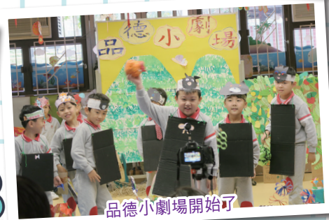
品德小劇場開始了