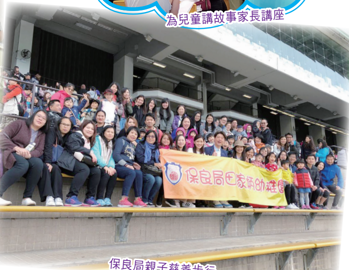
保良局親子慈善步行