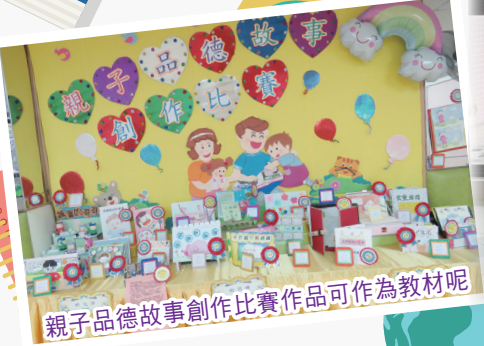
親子品德故事創作比賽作品可作為教材呢