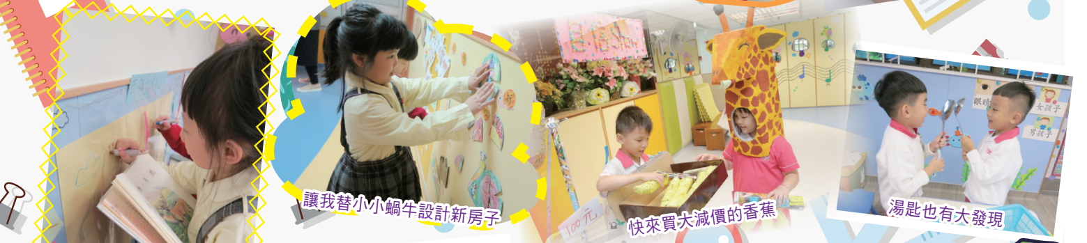
讓我替小小蝸牛設計新房子