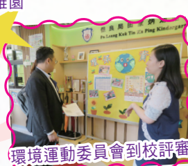
環境運動委員會到校評審