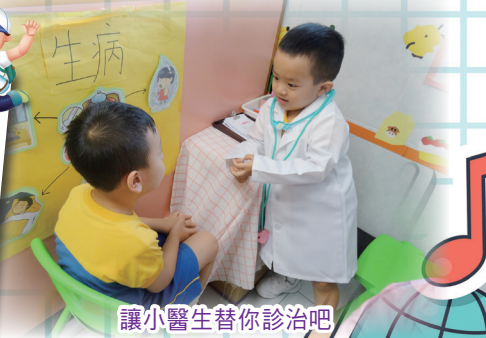
讓小醫生替你診治吧