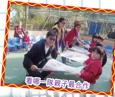
看哪一隊親子最合作