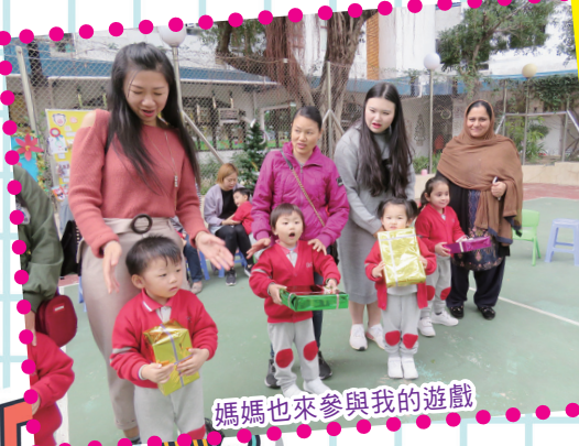
媽媽也來參與我的遊戲