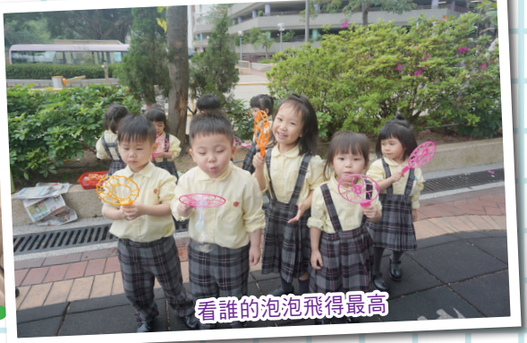
看誰的泡泡飛得最高