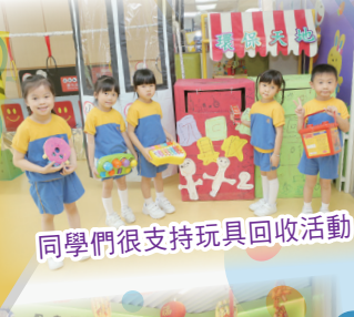
同學們很支持玩具回收活動