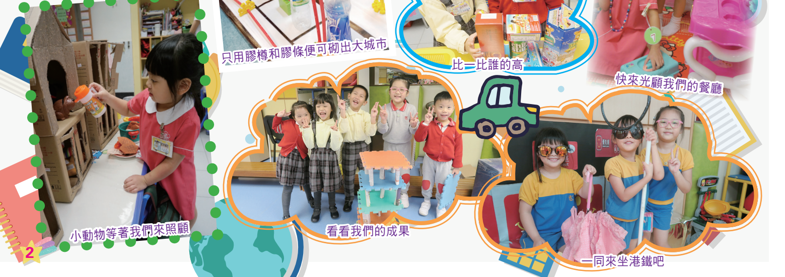
小動物等著我們來照顧