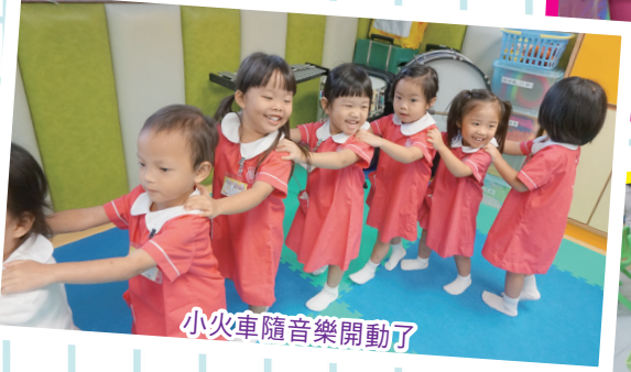
小火車隨音樂開動了