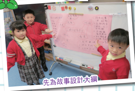
先為故事設計大綱