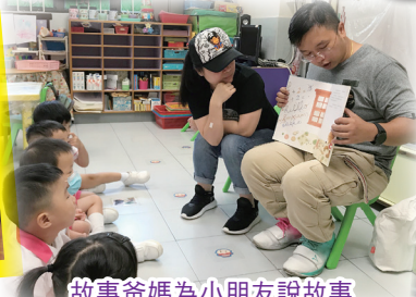
故事爸媽為小朋友說故事