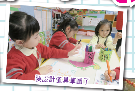
要設計道具草圖了