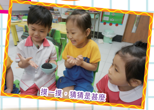
摸一摸，猜猜是甚麼