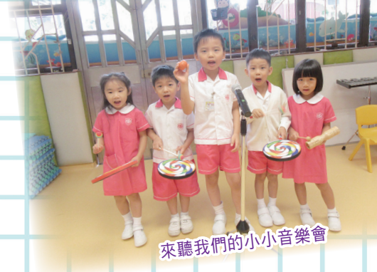
來聽我們的小小音樂會