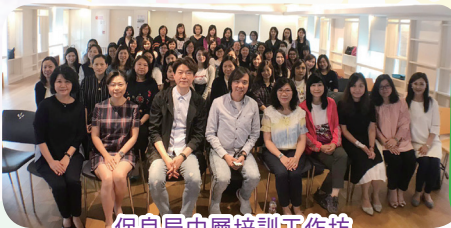
保良局中層培訓工作坊