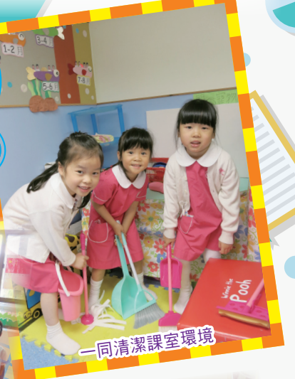
一同清潔課室環境