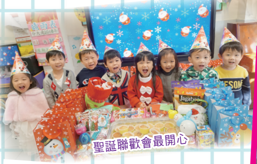
聖誕聯歡會最開心