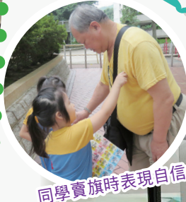
同學賣旗時表現自信