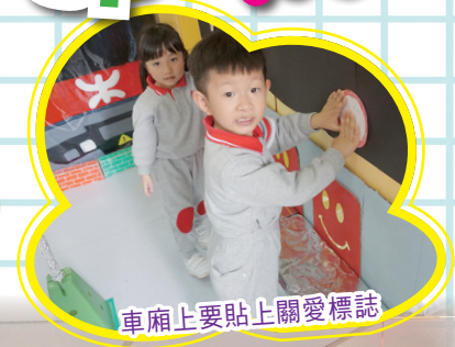
車廂上要貼上關愛標誌