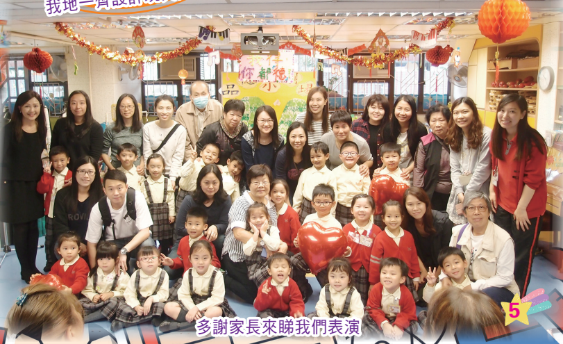
多謝家長來睇我們表演