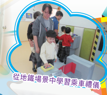
從地鐵場景中學習乘車禮儀