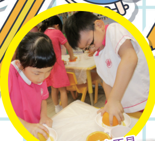
滴滴橙汁得來不易