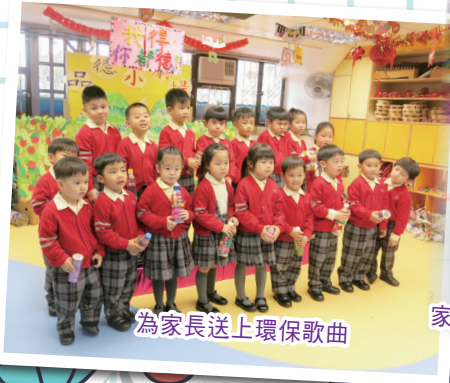
為家長送上環保歌曲