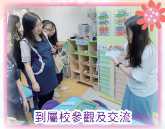
到屬校參觀及交流