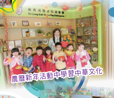
農曆新年活動中學習中華文化