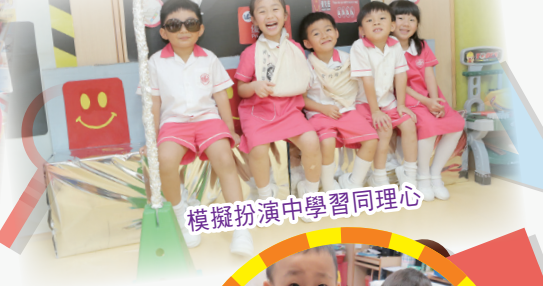
模擬扮演中學學習同理心