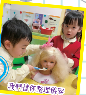
我們替你整理儀容