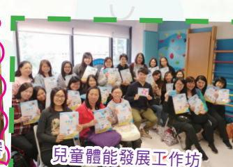
兒童體能發展工作坊