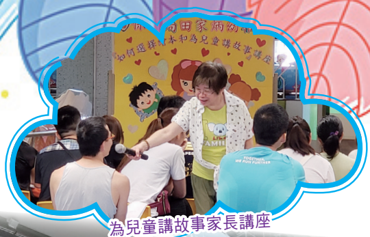
為兒童講故事家長講座