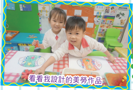
看看我設計的美勞作品