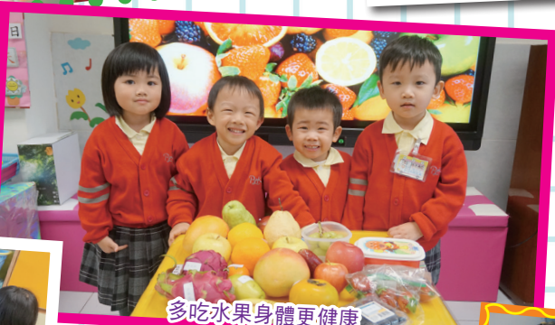
多吃水果身體更健康