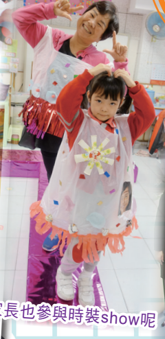
家長也參與時裝show呢