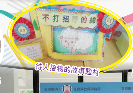
待人接物的故事題材