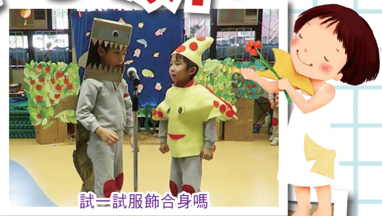
試一試服飾合身嗎