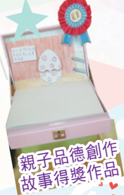
親子品德創作故事得獎作品