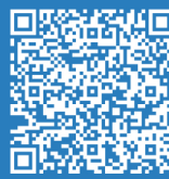
國際中華文化嘉年華